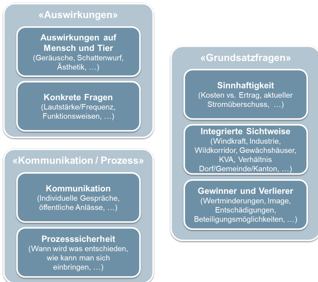
Abbildung 2: Sieben Gesprächsschwerpunkte, die immer wieder zur Sprache kamen (eigene Darstellung)

Die dritte wichtige Themengruppe waren Grundsatzfragen, z.B. zum Umgang mit Gewinnern und Verlierern des Projektes, dem Wunsch, das Windkraftprojekt im Gesamtsystem der Region zu betrachten ( Integrierte Sichtweise ) sowie Fragen dazu, ob das Projekt überhaupt sinnvoll ist ( Sinnhaftigkeit ).