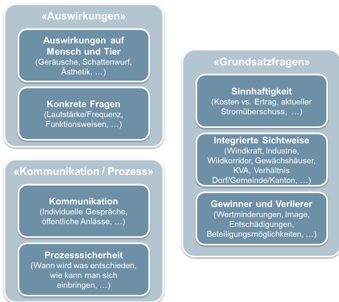
Abbildung 1: Sieben Gesprächsschwerpunkte, die immer wieder zur Sprache kamen (eigene Darstellung)

Zu verschiedenen Themen äusserten die Gesprächsteilnehmenden auch konkrete Fragen , auf die sie von SAK Antworten erwarten. Zusätzlich gaben einige Gesprächsteilnehmende aber auch konkrete Vorschläge für das weitere Vorgehen an die SAK mit. Sowohl Fragen, wie auch die Vorschläge sind im vorliegenden Bericht aufgeführt.