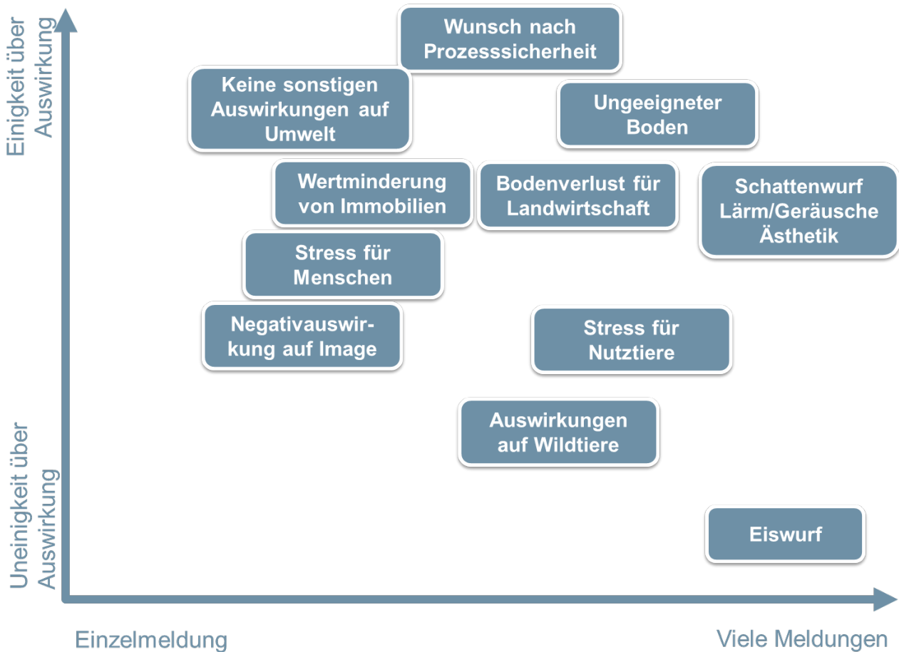
Abbildung 3: Konsens bzw. Dissens bei unterschiedlichen Auswirkungen der geplanten Windkraftanlagen (eigene Darstellung)

Diese unterschiedlichen Sichtweisen (vgl. dazu Kapitel 3.1 Fazits der Gespräche, Seite 22 ) zeigten sich auch darin, dass längst nicht bei allen Themengebieten die gleichen Einschätzungen geteilt werden, welche Auswirkungen die Windkraftanlagen haben und wie diese zu bewerten sind. Nur bei wenigen Themen herrschte weitgehende Einigkeit. So ist der Boden (rechts oben) der Region in den Augen fast aller nicht ideal für eine Windkraftanlage. Dass dies zumindest zu Mehrkosten führt, ist unbestritten. Ebenso unumstritten ist der «Wunsch nach Prozesssicherheit». Es beschreibt das Bedürfnis der Anspruchsgruppen, zu wissen, was wann entschieden wird und wo welche Möglichkeit für einen Austausch existiert. Bei anderen Themen, wie den Auswirkungen auf Nutz- und Wildtiere, gibt es sehr unterschiedliche Einschätzungen. Und die Frage, ob Eiswurf (rechts unten) ein ernsthaftes Problem darstellt ist bei den Gesprächspartnern/innen gänzlich umstritten. Dessen Einschätzung ist primär davon abhängig, ob man davon ausgeht, dass die Rotorblätter rechtzeitig beheizt werden, um die Eisbildung zu verhindern. Es ist anzumerken, dass auch diese grafische Darstellung keine repräsentative Auswertung darstellt, sondern lediglich Indizien liefert bezüglich Konsens und Dissens bezüglich der Auswirkungen in der Region.